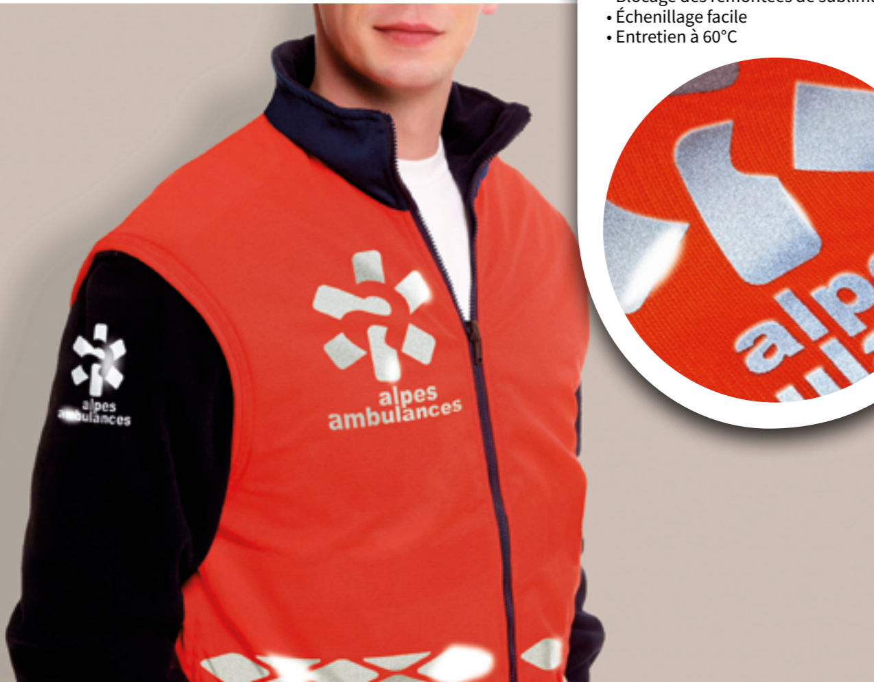
Planche Reflect Silver